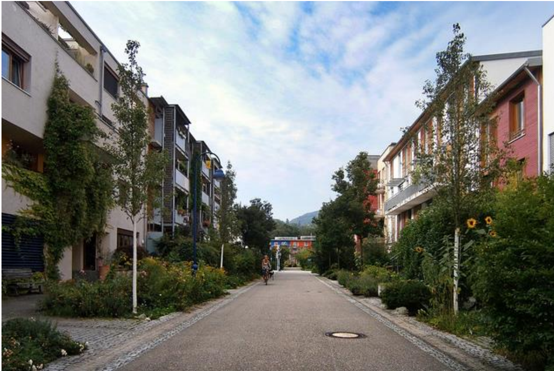
Abbildung: Das nachhaltige Quartier Vauban in Freiburg im Breisgau