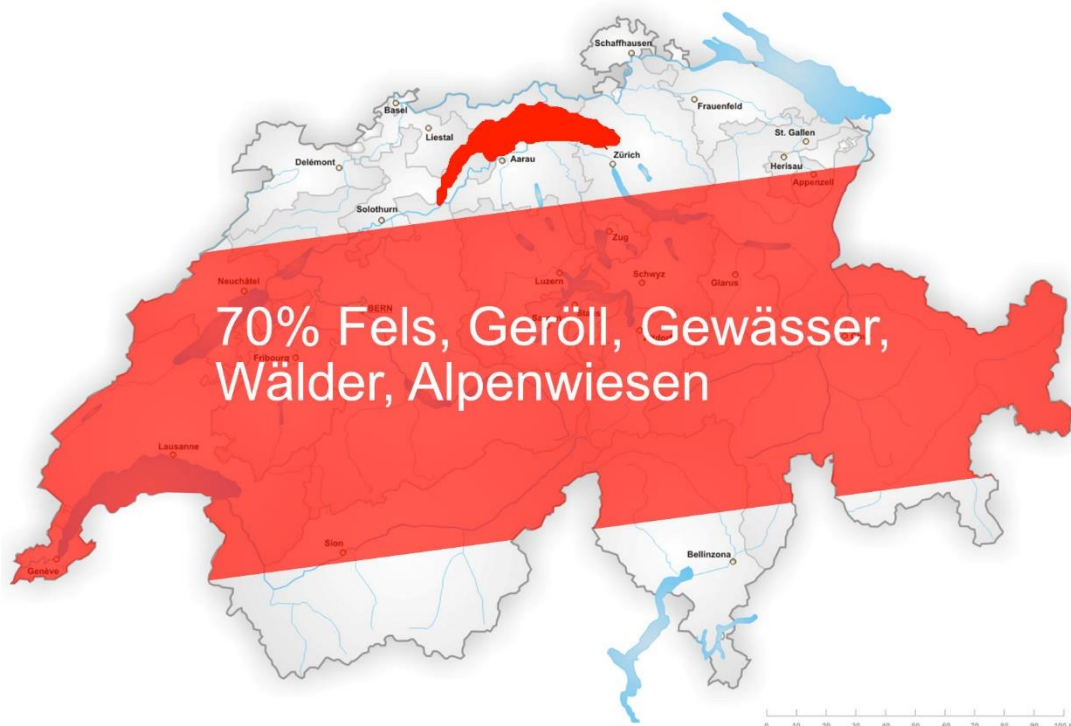
Abbildung: Seit 1985 wurde in der Schweiz die Fläche des Genfersees zubetoniert. Das ist insbesondere deshalb bedenklich, da ca. 70 % der Schweizer Fläche von vornherein nicht nutzbar sind

Der Grad der Zersiedelung wird aber nicht nur vom Flächenverbrauch per se bestimmt, sondern auch durch dessen räumliche Aufteilung. Je weiter zerstreut die Gebäude erstellt werden, umso mehr nimmt die Zersiedelung zu. Und je mehr die Zersiedelung zunimmt, desto länger werden die Verkehrswege und desto mehr Verkehr entsteht. Durch den Strassenbau werden zahlreiche Naturräume zerschnitten und viel Boden geht verloren. Von 1985 bis 2009 hat beispielsweise die Fläche für Autobahnen um 49 % und die Fläche für Parkplätze um 55 % zugenommen. Auch hier ist das Wachstum ein Vielfaches des Bevölkerungswachstums. 2