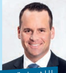
Damian Müller, Ständerat LU

«Die Kündigungsinitiative ist eine der wirtschaftsfeindlichsten Initiativen, über die wir je abstimmen mussten. Man redet von Zuwanderung, zerstört aber Innovation und Vertrauen!»