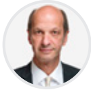
Beat Rieder Ständerat CVP