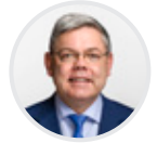
Franz Grüter Nationalrat SVP

Schweizer Unternehmen sollen Verantwortung tragen, die Initiative setzt aber auf die falschen Instrumente. Denn sie schwächt die Schweiz, benachteiligt Schweizer Unternehmen und schadet insbesondere jenen, denen sie vorgibt zu helfen. Bundesrat, National- und Ständerat lehnen die Initiative klar ab. Auch die CVP und die Fraktionen der FDP und der SVP, economiesuisse, viele Branchenverbände, die kantonalen Handelskammern und zahlreiche kantonale Gewerbeverbände sprechen sich entschieden gegen die Initiative aus.