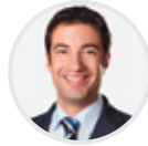
Andrea Caroni Ständerat FDP