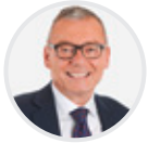
Ruedi Noser Ständerat FDP