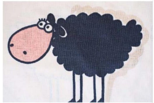
Gehorsam und wissbegierig fragte Hansli seine Lehrerin, ob er nun ein Schwarzes oder ein schwarzes Schaf gezeichnet habe.

Zuerst einmal wird in dieser Studie, die in drei Broschüren angeboten wird, erklärt, dass man nicht «schwarze Menschen» schreiben darf, sondern «Schwarze Menschen» mit einem grossen S. Dies, weil es nicht um die Hautfarbe gehe. Schwarz mit grossem S sei eine politische Bezeichnung für Menschen mit Rassismuserfahrung. Womit schon einmal klargestellt wäre, dass sämtliche Schwarzen Menschen Erfahrung mit Rassismus haben. Wenn nicht, sind diese Menschen nicht Schwarz, sondern höchstens schwarz mit kleinem s. Zudem bedeute Schwarz mit grossem S eine soziopolitische Positionierung und eine emanzipatorische Widerständigkeit. Alles klar? Problemlos hingegen darf weisse Menschen mit kleinem w geschrieben werden, obwohl deren Hautfarbe ja auch nicht schneeweiss ist.