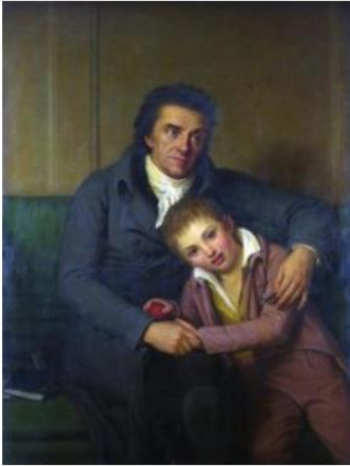
Pestalozzi in Stans: Grosse Hingabe

In Burgdorf begann er als einfacher Lehrer, wurde später Leiter des Instituts auf dem Schloss und zum wichtigsten Pädagogen im Lande und des deutschen Sprachbereichs. Erstmals entwickelte er seine „Methode“ im Buch „Wie Gertrud ihre Kinder lehrt“, die er einmal im folgenden Satz zusammenfasste: „Einsicht, Liebe und Berufskraft vollenden den Menschen. Der Zweck der Erziehung ist einzig diese Vollendung...“. Er erkannte, dass Schüler beim Lernen eine systematische Anleitung brauchen. Für ihn war die Anschaulichkeit der Unterrichtsmethoden zentral. Ausgehend von der «Anschauung» mussten sich die Kinder klare und richtige Vorstellungen von den Dingen machen, denn jede Erkenntnis gehe von der sinnlich erfahrbaren Realität aus. Ebenso wichtig waren ihm die Gemütsbildung und die soziale Verbundenheit in der Schulklasse und mit dem Lehrer. Während die Pädagogik Humboldts