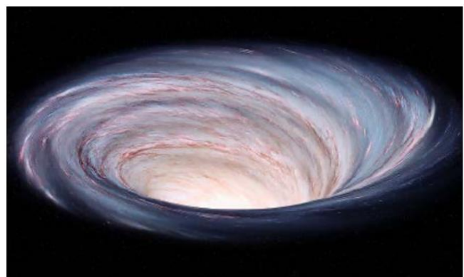
Nach der Astronomiestunde war sich die Klasse einig, dass es wohl besser ehrfurchtsvoll das Schwarze Loch sei und bleibe. Es warte dann vielleicht länger, bevor es die Erde verschlucke.

Afrikaner seien nicht gleich Afrikaner. Es soll gefälligst Äthiopier oder Algerier gesagt werden, denn die Menschen und deren Kulturen seien unterschiedlich. Das Wort «Europäer» hingegen ist erlaubt. Es weiss schliesslich jedes Kind, dass es keinen Unterschied zwischen Spaniern und Norwegern gibt. Wobei die Autorinnen auf das Wort Europäer ebenfalls verzichten, sie bevorzugen die charmante Bezeichnung «westliche Unterdrücker*innen». Auch Ausdrücke wie «mutige Forscher» müssten durch «plündernde