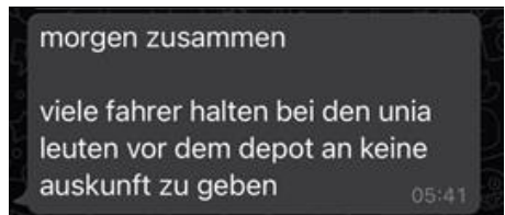
Teamchat eines Subunternehmers

bei Kontakt mit der Unia die Kündigung drohe und zeigen ein SMS von den Subunternehmern (welche ihrerseits wohl auf Anweisung von DPD handeln) mit der Anweisung, nicht mit der Gewerkschaft zu sprechen.