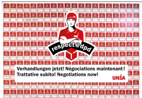
Postkarten-Aktion der DPD-Fahrer*innen, Februar 2021

DPD ist somit offensichtlich nicht bereit daran mitzuwirken, die Arbeitsbedingungen im «System DPD» zu verbessern. Den Fahrer*innen und ihrer Gewerkschaft bleibt daher nichts anderes übrig, als die Missstände öffentlich zu machen und DPD weiterhin aufzufordern, sozialpartnerschaftlich am Verhandlungstisch Lösungen für die offensichtlichen Probleme zu finden.