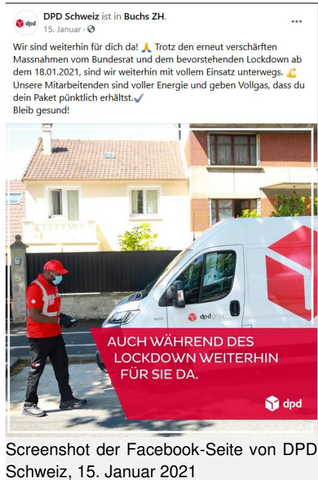
Screenshot der Facebook-Seite von DPD Schweiz, 15. Januar 2021

Das «System DPD» hat während der Covid-19-Pandemie zu unhaltbaren Situationen geführt. Der Unia wird oft berichtet, dass Fahrer*innen von den Subunternehmern angehalten werden, auch mit Krankheitssymptomen zu fahren. Mehrere wurden sogar aufgefordert trotz positivem Covid-Test zu arbeiten und den Arbeitskolleg*innen nichts zu erzählen. Das hat zu hoher Ansteckungsgefährdung in den Depots geführt. Wenn Fahrer*innen mit positiven Tests in Quarantäne mussten, wurde in den Depots nach unseren Informationen weder von DPD noch von Seiten der Subunternehmer informiert. Mehrere Fahrer sind sich sicher, sich bei der Arbeit angesteckt zu haben. Es gibt mehrere Berichte, dass Fahrer*innen mit Corona während ihrer Abwesenheit Ferien eintragen mussten oder der Lohn zurückgehalten wurde.