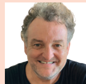
Marco Rima, Kabarettist, ZG

«Das Coronavirus ist real, keine Frage. Doch wie unser Staat mit Lügen und Erdichten seine Bürger unter Druck setzen will, lässt mich aufhorchen. Die Parallelen zu den 1930er-Jahren sind bedenklich.»