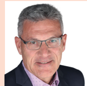
Pirmin Schwander, Nationalrat, Lachen SZ

«Das Covid-Zertifikat widerspricht dem Rechtsstaat und der offenen Gesellschaft: Ohne jede Evidenz werden Menschen dem Generalverdacht unterstellt, andere zu schädigen. Von diesem Verdacht müssen sie sich durch ein Zertifikat unter willkürlichen Bedingungen reinwaschen.»