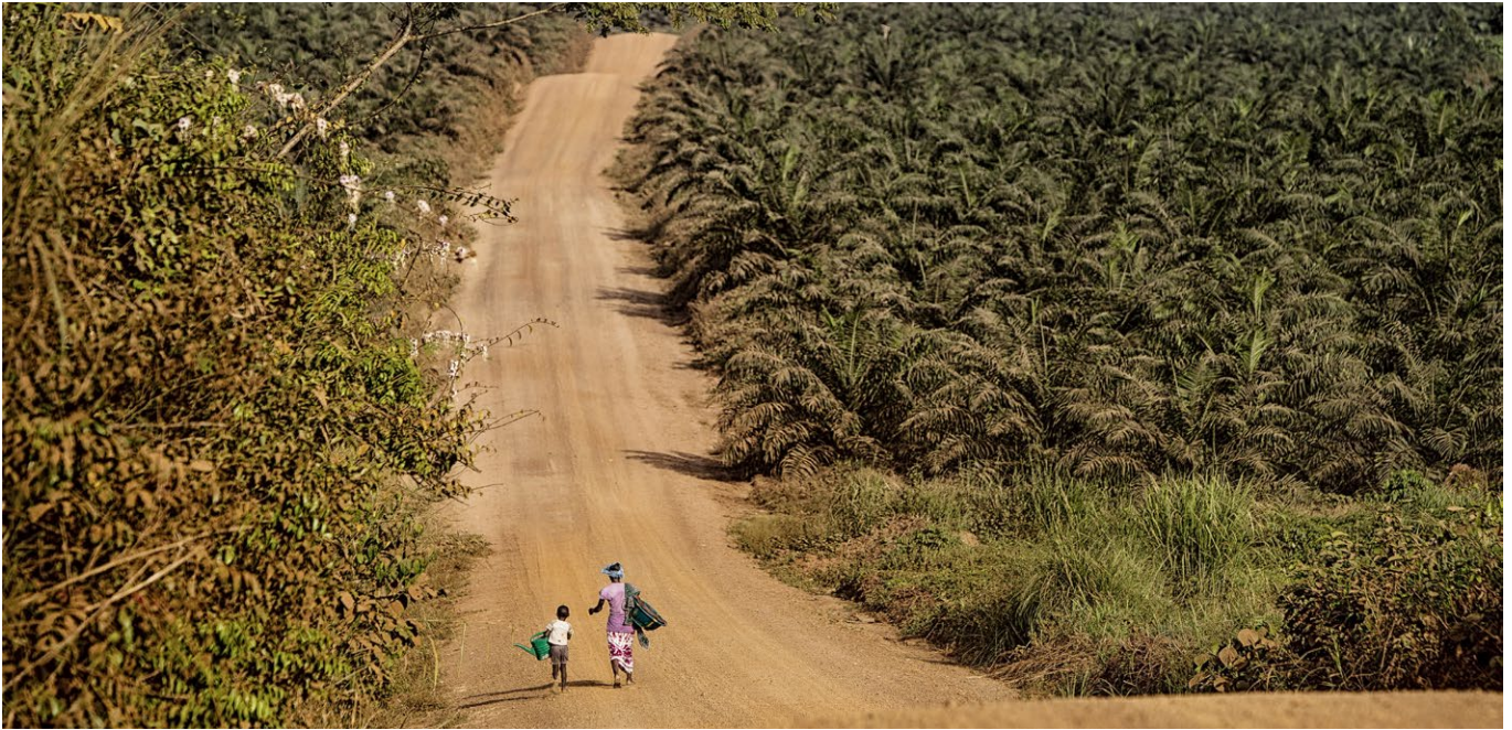
Von 14 Millionen Euro, die auf der SAC-Plantage in Sierra Leone für Massnahmen im Rahmen der Corporate Social Responsibility vorgesehen waren, wurden nur 2,2 Millionen Euro tatsächlich ausgegeben. Der Bau und die Instandhaltung von Strassen war der einzige Budgetposten, der 2017 eingehalten und sogar überschritten wurde.

Die Socfin-Tochtergesellschaften in den untersuchten Ländern beschäftigen Gelegenheitsarbeiter, die von Subunternehmern angeheuert und temporär oder sogar als Tagelöhner angestellt werden. Die tatsächlichen Lohnzahlungen sind oft an bestimmte Leistungsquoten geknüpft. Dadurch wird auf die Arbeitnehmenden hoher Druck ausgeübt, und das Unfallrisiko steigt. Leider ist dieses umstrittene Lohnmodell auf vielen Plantagen weltweit üblich.