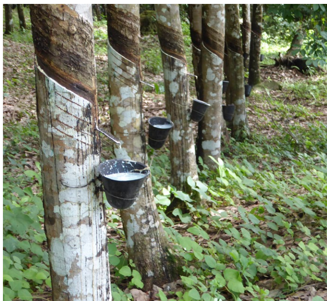
Kautschuk-Produktion auf der Plantage der Liberian Agricultural Company (LAC).

Socfin argumentiert, dass der Konzern alles zur Unterstützung der lokalen Bevölkerung unternehme. Der vorliegende Bericht zeigt jedoch, wie der Konzern in seinem arbeits- und flächenintensiven Kerngeschäft Kosten einspart, während er gleichzeitig seine Gewinne maximiert – mit schwerwiegenden Folgen für die Menschen vor Ort. Durch die Verlagerung der Gewinne aus den Produktionsländern bringen Unternehmen wie Socfin diese Regierungen um Steuereinnahmen, die sie in die Infrastruktur und den öffentlichen Sektor investieren müssten, um öffentliche Dienstleistungen für alle bereitzustellen.