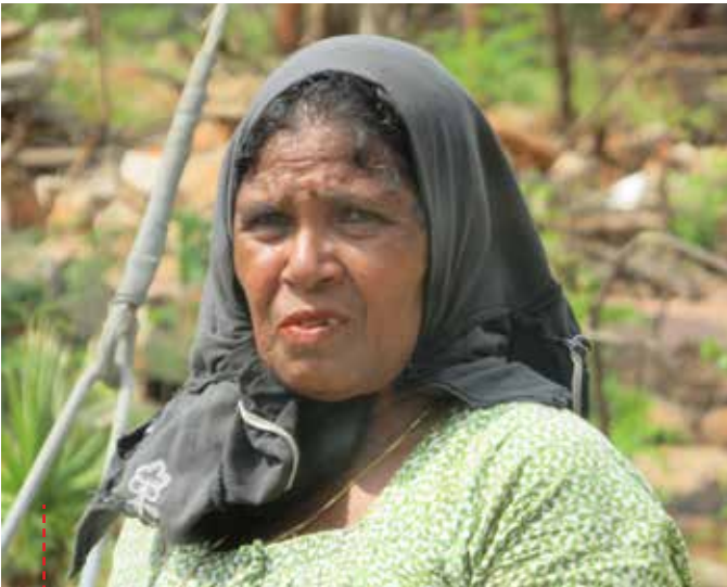
● Bewohnerin eines Lagers für intern Vertriebene auf der Jaffna-Halbinsel

Obschon der Krieg vor sieben Jahren endete, gibt es auf der Jaffna-Halbinsel immer noch Zehntausende Binnenvertriebene. Einige Tausende dieser intern Vertriebenen leben weiterhin in Lagern, wo die prekären Lebensbedingungen für Familien nicht angemessen sind. Gemäss Regierungsangaben lebten 2015 1'318 Familien (4'737 Personen) in 32 sogenannten «offenen Sozialhilfezentren». Jedoch stellte die NAFSO fest, dass 1'536 Familien im September 2015 in 38 Lagern alleine im Jaffna-Distrikt lebten. Die mangelnden sanitären Einrichtungen, die schlechte Abfallwirtschaft und Überschwemmungen in den Camps nach Regenfällen erhöhen das Risiko von Krankheiten und Unfällen. Ferner werden die Bewohner von solchen Lagern von der tamilischen Gesellschaft diskriminiert und müssen mit den langfristigen Folgen der gesellschaftlichen Ächtung leben. Auch haben die intern Vertriebenen kaum eine Chance auf eine Anstellung, weil sie aufgrund ihrer Situation als Mitglieder einer niedrigeren sozialen Kaste angesehen werden.