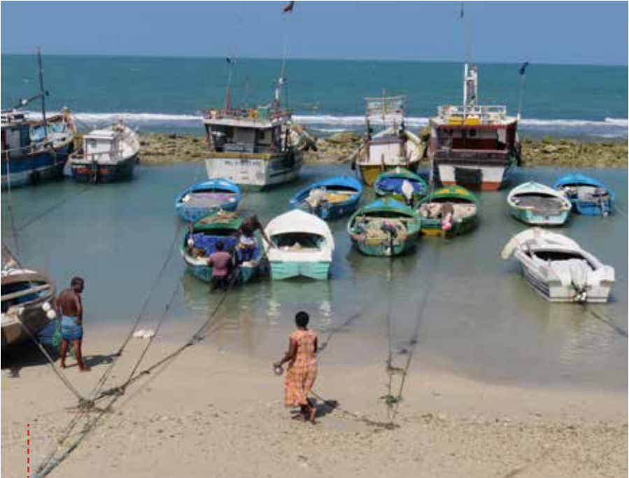
● Fischereihafen in Point Pedro auf der Jaffna-Halbinsel