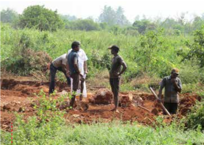
● Räumungsarbeiten in einem Wiederansiedlungsgebiet auf der Jaffna-Halbinsel

Wenn die Regierung ernsthaft um Versöhnung bemüht ist, muss sie die tamilisch dominierten Regionen von Sri Lanka demilitarisieren und die besetzten Gebiete ihren ursprünglichen Besitzern zurückgeben.