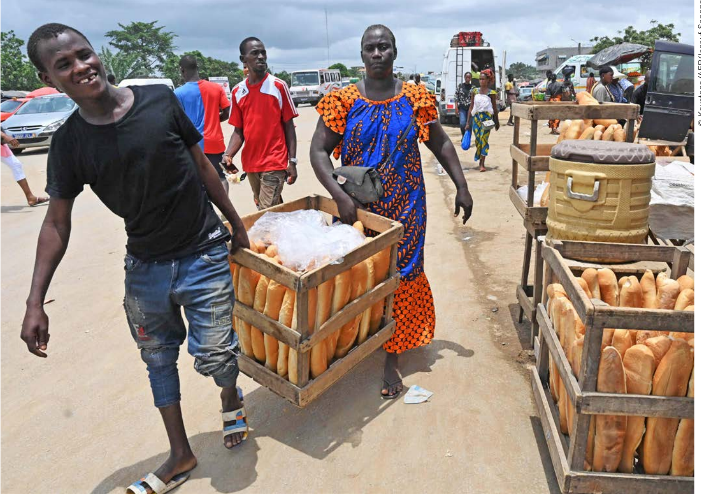
Strassenverkäufer in Abidjan, Elfenbeinküste. Backstuben ersetzen das Weizenmehl angesichts steigender Preise immer öfter mit Maniokmehl.