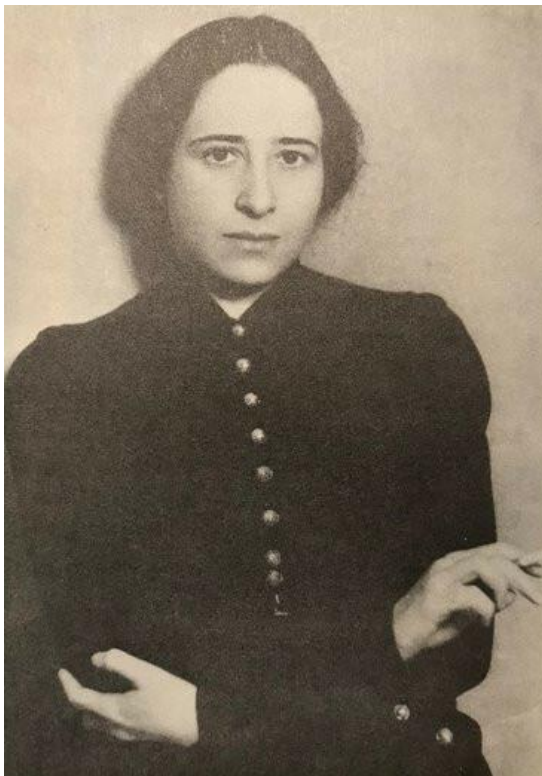
Hannah Arendt 1933

«Die Welt liegt zwischen den Menschen», unterstreicht Hannah Arendt 1959, als sie den renommierten «Lessing-Preis der Freien und Hansestadt Hamburg» verdankt. 3 Wie aber entsteht diese Welt?, fragt sie. Entscheidend sei das «Zwischen», betont Arendt. Hier bilde sich die gemeinsame Welt vieler Menschen – in ihrer Vielfalt und Verschiedenheit.