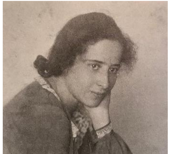
Hannah Arendt 1924