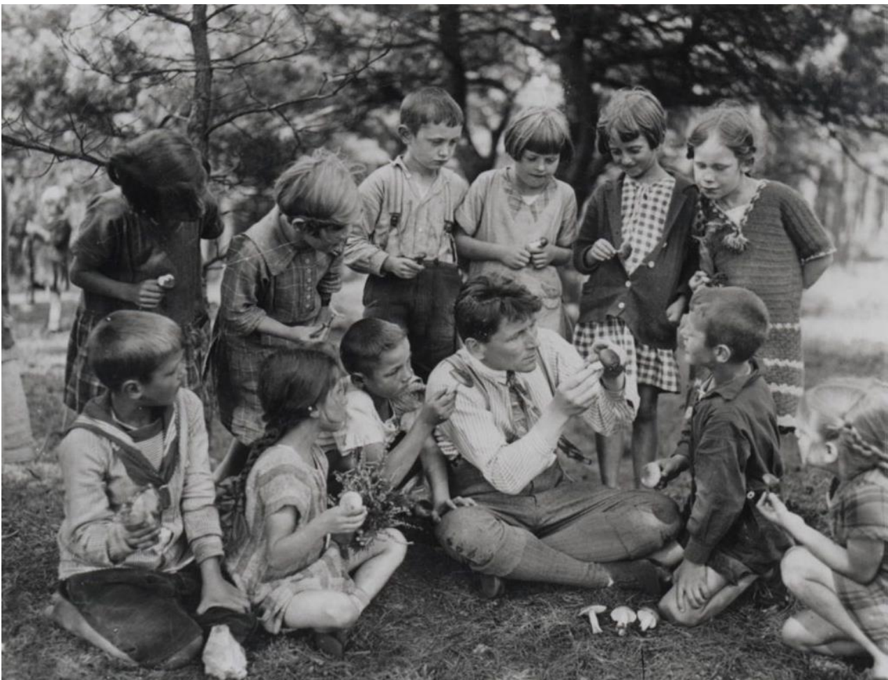
Der Reformpädagoge und Lehrer Carl Dantz 1927

Die Bildungspolitik kennt zwei primäre Stossrichtungen: Ökonomisierung und Digitalisierung. Gleichzeitig drängen EdTech-Konzerne und IT-Unternehmen in die Schule. Sie nehmen Einfluss auf Bildungsgehalte. Eine kluge Studie beleuchtet die Hintergründe und macht Mut fürs Pädagogische.