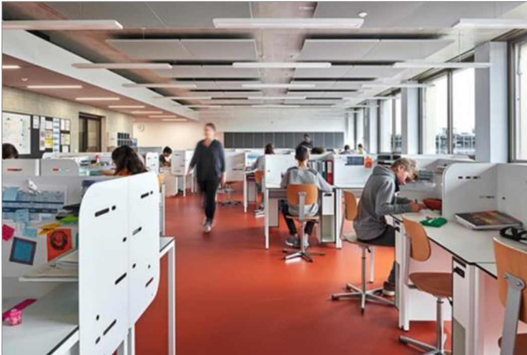
Das Schulzimmer der Zukunft? Einzelboxen? Jeder sein eigener Lerner? Die Sekundarschule Sandgruben Basel

menschliche Vis-à-Vis. Lernen basiert auf dem direkten Kontakt mit Menschen: Bildung als Erlebnis von gemeinsamer Gegenwärtigkeit. Das zu betonen bedeutet aber nicht, ein Relikt aus Jeremias Gotthelfs Zeiten zu revitalisieren oder die digitalen Möglichkeiten zu eliminieren.