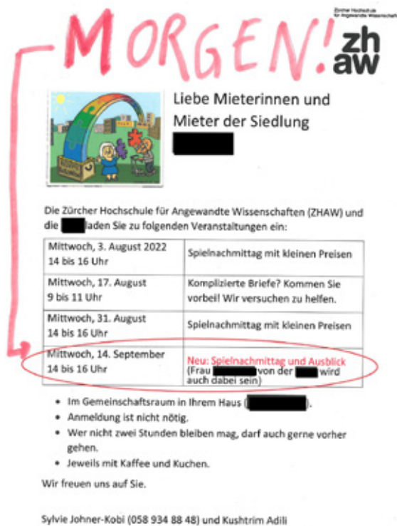
Abbildung 3: Reminder für eine Siedlungsaktivität

Erfolgversprechend, um auch schwer erreichbare Personen zu erreichen, sind folgende Faktoren: 1.) ihre Bedürfnisse gut zu kennen, 2.) Vertrauenspersonen (zum Beispiel Hauswartungsperson) zu nutzen, um die Bewohner:innen über die Angebote/Veranstaltungen zu informieren, 3.) über verschiedene Kanäle zu informieren (schriftlich, mündlich, einfache Sprache, mehrsprachig), 4.) Niederschwelligkeit eines Angebots zu garantieren (keine Anmeldung und anderes), 5.) Reminder einzuplanen (siehe zum Beispiel Abbildung 3 und 6.) Kostenlosigkeit des Angebots zu garantieren.