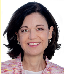
Regine Sauter Nationalrätin FDP.Die Liberalen

«Ich sage NEIN zur 13. AHV-Rente, da sie zusätzliche Abgaben und Steuern für den Mittelstand und die Familien verursachen würde.»